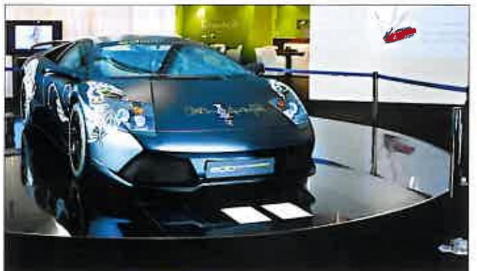
Solitär Lamborghini auf WiteX „Color“ ELESGO®