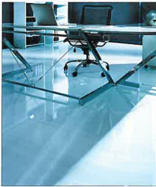
Hightec auf WiteX „Color“ Hochglanz weiß