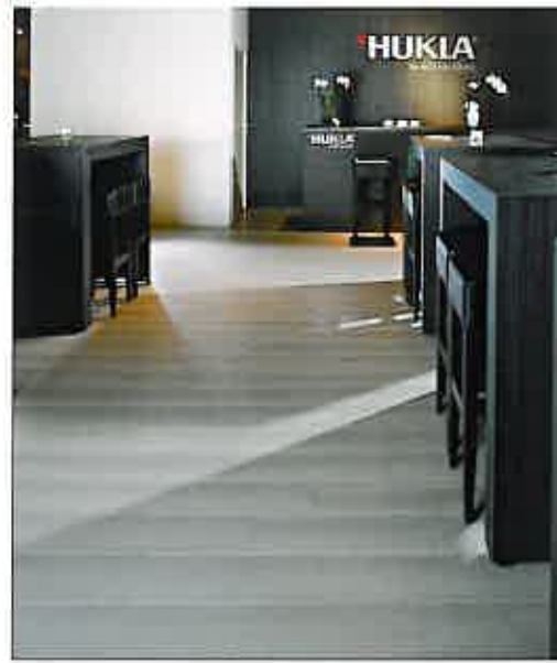
Harmonische Kontraste „Catania V4“ als Landhausdiele