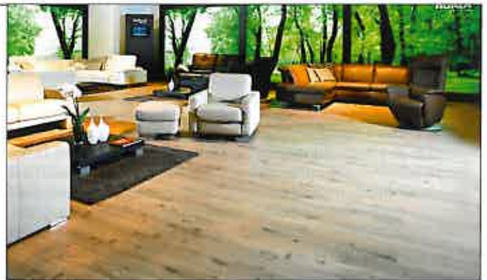
Wohnliches Flair „Marena“ im Oberflächendekor Eiche

Messeböden müssen aber nicht nur die effektvolle Präsentation von Produkten unterstützen, an sie werden darüber hinaus weitere hohe Anforderungen gestellt: In den zeitlich meist auf drei bis sechs Tage befristeten Messe-Veranstaltungen wird der Fußboden von Tausenden Besuchern „betreten“ und muss einer Belastung standhalten, die er im normalen Wohngebrauch kaum in seinem gesamten Lebenszyklus erfährt. Noch entscheidender als die Produktunterstützung und Belastbarkeit sind aber Faktoren, die der enge Zeitrahmen bei der Messenvorbereitung vorgibt: Messebauer und Aussteller müssen die Gewähr haben, dass der Fußboden just in time zur Verfügung steht.