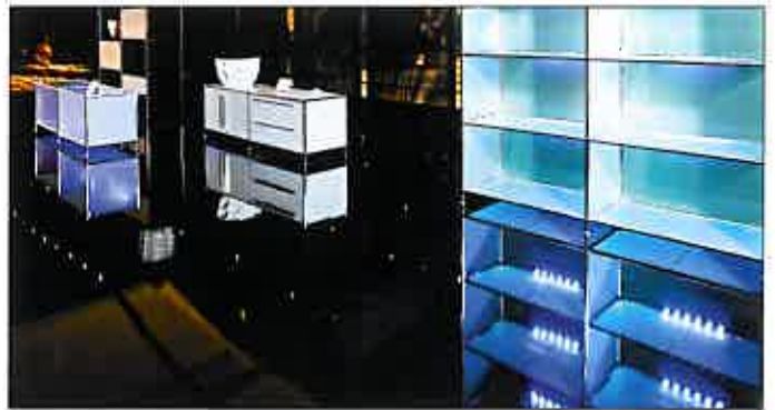
Black and White Effektvolle Präsentation auf WiteX „Color“ Hochglanz schwarz