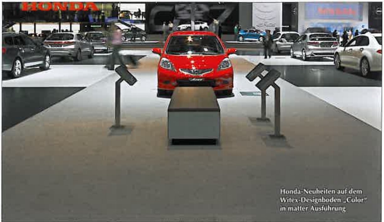
Honda-Neuheiten auf dem Witex-Designboden „Color“ in matter Ausführung

bereits exklusiven Ferrari 599 GTB Fiorano – seine Weltpremiere. Dieser noch exklusivere Supersportler präsentierte sich auf dem Hochglänzboden wie ein Juwel.