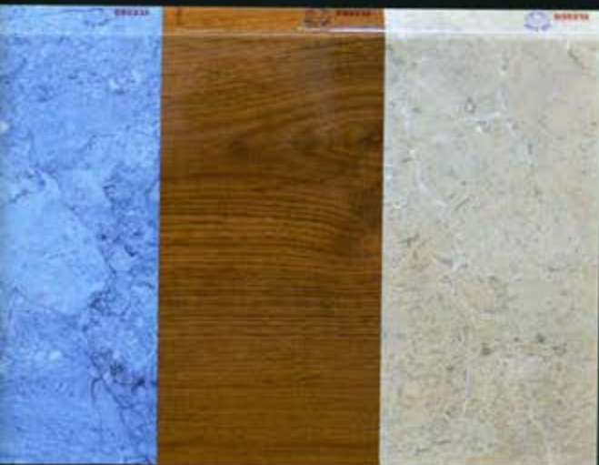
Links: Kunststoff-Fensterbankprofile mit verschiedenen ESH-Oberflächen