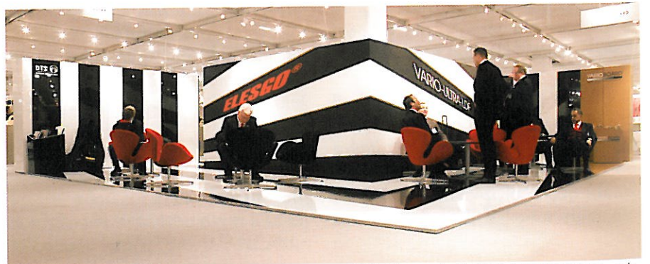
ZOW fuarındaki DTS / ELESGO Standı.