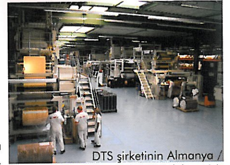
DTS şirketinin Almanya / Möckern'deki tesisi.

ELESGOtherm ürünü çizilmeye karşı yüksek dayanıklılığa sahiptir.