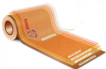
Schichtaufbau der ELESKO®-Oberfläche Layer structure of the ELESKO®-surface

For most insiders in the industry, the abrasion-resistant lacquered laminates from DTS Systemoberflächen GmbH are a byword for laminate floorings under the brand name ELESKO®. What is less widely known is that using ELESKO® laminates, CPL can be given an attractive high-gloss surface, and that HPL can also be upgraded using ELESKO® as a top layer. In a presentation held during the Interior Surfaces Conference 2007 in Amsterdam last April, Klaus Wittmann demonstrated these interesting options for the laminate industry to an audience of specialists.